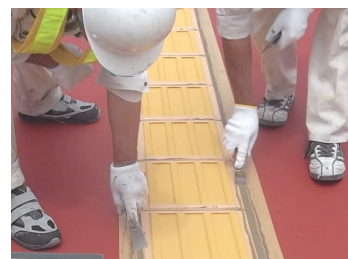
5 プレート外側目地と、つなぎ目地の接着剤をヘラで仕上げ