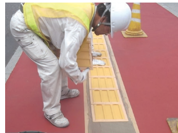
4 プレート裏面にエアたまりができないようにプレートを圧着