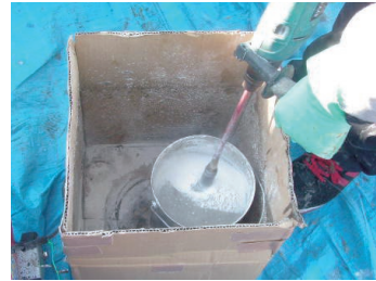
2 主剤に骨材、規定量硬化剤を投入し、ミキサーでよく混合