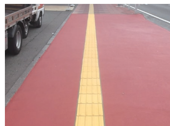
8 テープを除去し、硬化したら完成