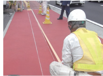
1 設置箇所を作図し10mm程度外側にテープでマスキング