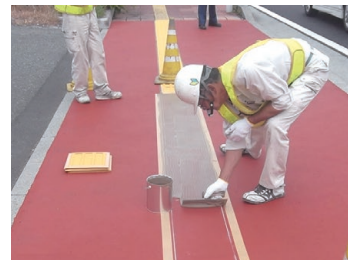
3 接着剤をクシメゴテで均一に塗布