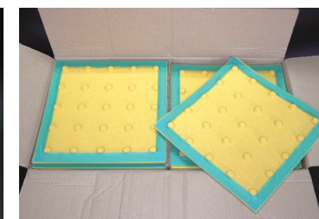
製品出荷時は内貼りマスキングテープが貼付けてあります

材質:アクリル樹脂 警告・誘導 300×300 20枚入り 内貼りマスキング仕様